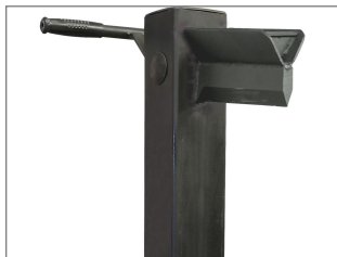
Stała kolumna rozdzielająca