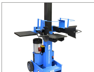
Mocny silnik elektryczny 400 V