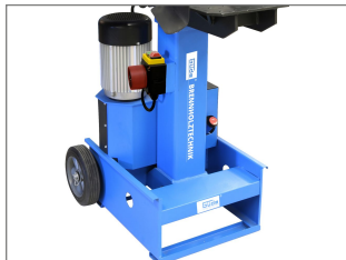
Dzielona taca na materiał po obu stronach